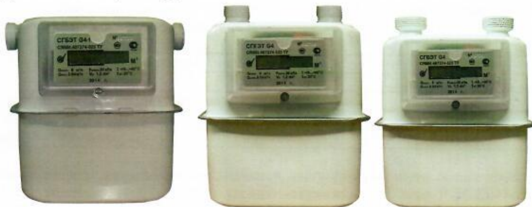
Рисунок 1 – Общий вид счетчиков газа бытовых с электронным термокомпенсатором СГБЭТ и СГКЭТ

Счетчики (СГБЭТ G4, СГБЭТ G2,5, СГБЭТ G4-1, СГБЭТ G2,5-1, СГКЭТ G4, СГКЭТ G2,5) имеют единое, конструктивное исполнение.